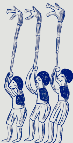
Illustration fra Gundestrupkarret, som viser tre carnyxspillere, jernalder, ca. 2200 år gammel.

Carnyx'en er kendt for sit vildsvinehoved. Hovedformen gav en særlig brølende lyd oven i truttet, når man blæste i det.